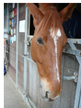
Perle Hari 6